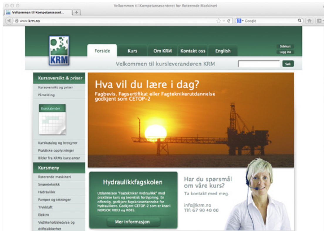
På www.krm.no finner du kursinformasjon, oversikter, datoer, tidspunkter og priser – samt påmeldingskjema.

KRM AS har engasjert Skandinavias ledende spesialister innen fagområdene kule-/rullelagre, smøreteknikk, hydraulikk, elektro, pumpeteknikk, trykkluft, forebyggende vedlikehold og automasjonsteknikk. Sammen med NKI Nettstudier er det etablert et videreutdanningstilbud for hydraulikere, Hydraulikkfagskolen , som er godkjent av NOKUT som fagskole og fører frem til Fagtekniker Hydraulikk (CETOP 2).